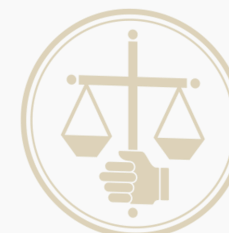
Балтийская коллегия адвокатов Санкт-Петербурга