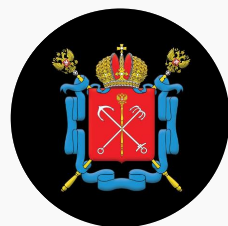
Уполномоченный по правам человека в Санкт-Петербурге