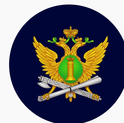
Главное управление Федеральной службы судебных приставов по Санкт-Петербургу