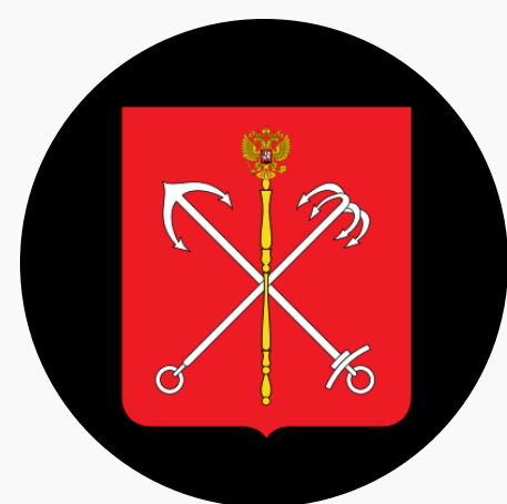
Комитет по молодёжной политике и взаимодействию с общественными организациями Санкт-Петербурга