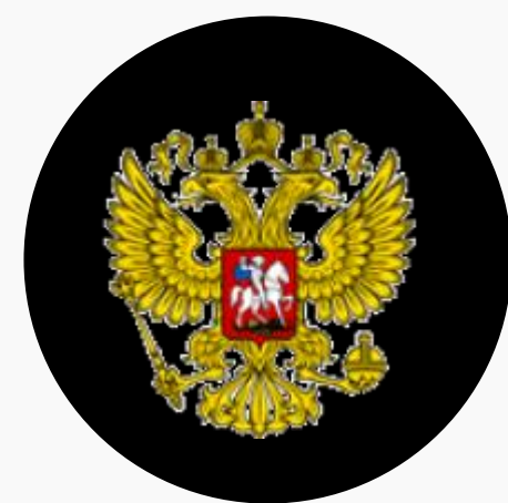
Арбитражный суд Санкт-Петербурга и Ленинградской области